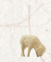
09.065.1F/S Lamm weidend Agneau broutant Lamb grazing