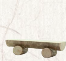
09.081.0F Sitzbank Banc Bench