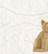
09.079.0F Katze sitzend Chat assis Cat sitting