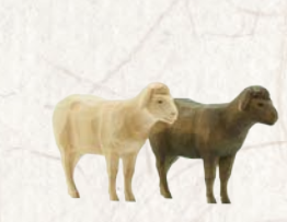
09.064.0F/S Schaf stehend Mouton debout Sheep standing