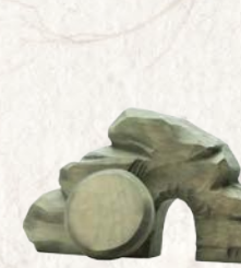
09.093.0F Gruft mit Stein Tombe avec rocher Tomb with rock