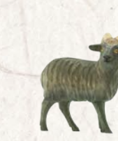
09.064.9F Langhaarschaf Kopf rechts Mouton à poil long tête à droite Long-haired sheep head right