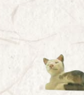
09.079.1F Katze liegend 2015 Chat couché 2015 Cat lying down 2015