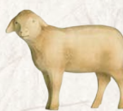
09.064.5F/S Schaf Kopf seitwärts Mouton tête de côté Sheep head sideways