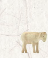
09.065.0F/S Lamm stehend Agneau debout Lamb standing