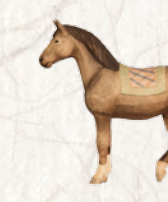
09.075.0F Reitpferd Cheval de selle Riding horse