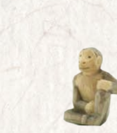
09.078.0F Affe 2015 Singe 2015 Monkey 2015