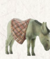
09.063.0F Eselsmit Decke Âne avec couverture Donkey with blanket