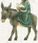
09.001.4F Maria auf Esel mit Kind La Vierge sur âne avec enfant Virgin Mary on donkey with child