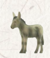
09.063.5F Esellohnen stehend Poulain d'âne debout Donkey foal standing