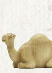
09.069.0F Dromedar liegend Dromadaire couché Dromedary lying down