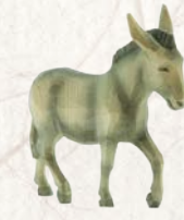
09.062.3F Eselschreitend Âne marchant Donkey walking

Tel. +41 (0)33 952 10 00 | Fax +41 (0)33 952 10 01 info@huggler-holzbildhauerei.ch www.huggler-holzbildhauerei.ch