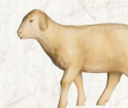
09.064.4F/S Schaf Kopf hoch Mouton tête haute Sheep head high