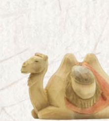
09.072.0F Kamel liegend Chameau couché Camel lying down