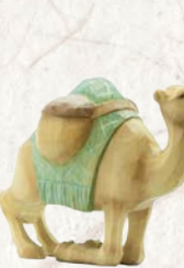
09.073.0F Dromedar kniend 2015 Dromadaire agenouillé 2015 Dromedary kneeling 2015