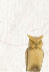
09.079.5F Eule Hibou Owl