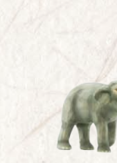
09.077.1F Junger Elefant Rüssel gerade Jeune éléphant trompe redressée Young elephant trunk straight