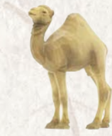
09.070.0F Junges Kamel Jeune dromadaire Young dromedary