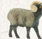
09.066.8F Langhaar-Widder Bélier à poil long Long-haired ram