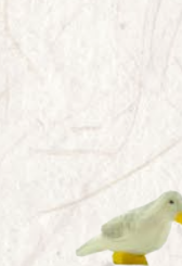
09.079.6F Taube sitzend Pigeon assis Pigeon sitting