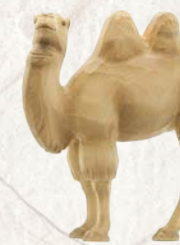
09.071.0F Kamel stehend Chameau debout Camel standing