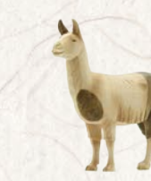
09.074.0F Lama Lama Lama