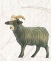
09.064.8F Langhaarschaf Kopf links Mouton à poil long tête à gauche Long-haired sheep head left