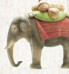
09.076.1F Elefant mit Gepäck Éléphant avec baggages Elephant with baggage