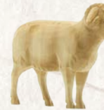
09.066.0F/S Widder Bélier Ram