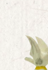
09.079.7F Taube Flügel offen Pigeon ailes ouvertes Pigeon wings open