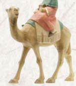
09.005.1F König Melchior auf Dromedar Le Roi Melchior sur dromadaire King Melchior on Dromedary