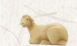
09.064.6F/S Schaf liegend Kopf seitwärts Mouton couché tête de côté Sheep lying head sideways