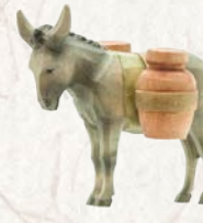
09.063.2F Eselsmit 2 Krügen Âne avec 2 jarres Donkey with 2 amphoras