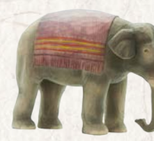
09.076.0F Elefant Éléphant Elephant