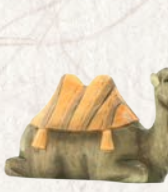
09.070.2F Junges Kamel liegend Jeune chameau couché Young camel lying down