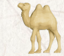
09.070.1F Junges Kamel schreitend Jeune chameau marchant Young camel walking