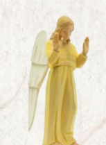
09.007.0F Engel stehend gelb Ange debout jaune Angel standing yellow