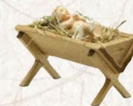
09.002.1F Kind in Krippe mit Heu Enfant en crèche avec foin Child in manger with hay