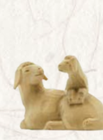
09.064.7F/S Schafgruppe Groupe de moutons Group of sheep