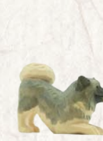
09.067.2F Hund bellend Chien aboyant Dog barking