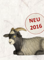
09.097.0F Langhaarschaf liegend Mouton à poil long couché Long-haired sheep lying down