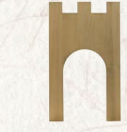
09.090.0F Stadtort Porte de ville Town gate