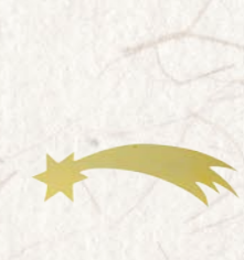
09.084.0F Stern Étoile Star