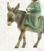
09.001.5F Maria auf Esel La Vierge sur âne Virgin Mary on donkey