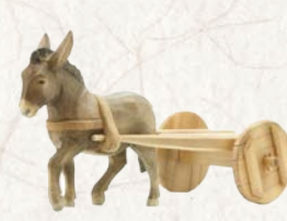
09.063.1F Eselsmit Wagen Âne avec chariot Donkey with cart