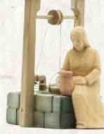
09.009.0F Frau am Brunnen* Femme au puits* Woman at well*